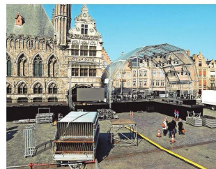
De opbouw van het podium op de Grote Markt.

IEPER – Vanavond worden op de Grote Markt van Ieper 10.000 toeschouwers verwacht voor 'De Passie'. Op de vooravond van Palmzondag wordt tijdens de Last Post het startsignaal gegeven voor een eigentijdse versie van het lijdensverhaal van Christus.